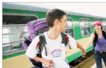
Die Koordinierungsstelle in der ZWH unterstützt Mobilitätsberater.

Die Fähigkeit, in einem internationalen Umfeld zu lernen und zu arbeiten, ist eine wichtige Voraussetzung für ein erfolgreiches Berufsleben in einer globalisierten Wirtschaft.